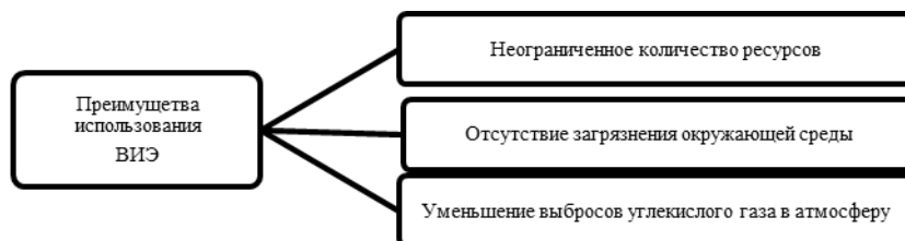
Рисунок 2 – Преимущества использования возобновляемых источников энергии

Применение возобновляемых источников энергии обладает рядом преимуществ (рис. 2):