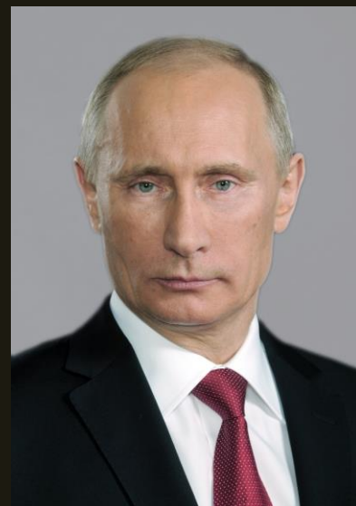
В.В. Путин Президент Российской Федерации