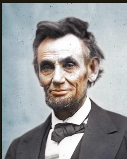
Абраам Линкольн Президент США