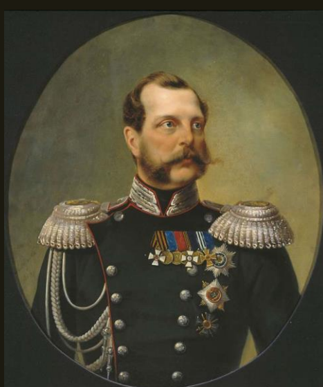
Александр II Российский Император