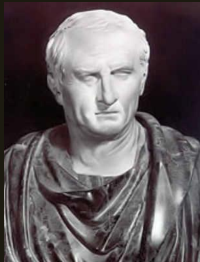
Цицерон Римский консул, философ